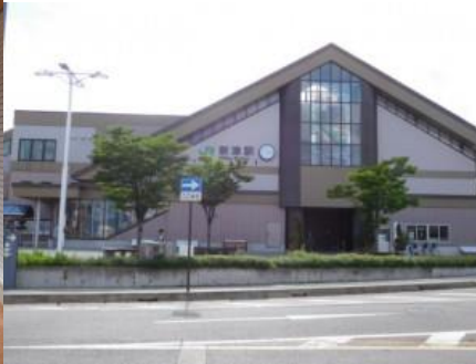
新津駅への路 新津駅

15時29分、単線である羽越本線の電修場踏切を横切る。さつき野駅には15時45分到着。階段を上り、反対側に出る。15時50分、北上踏切を横切り、鉄道の右側を歩く。16時3分、上下電車が通過して行く。16時6分、本日初めて鉄道に沿った農道（1 km）を歩く。16時12分、カラスの群れと対面。16時26分、荻川駅西口に到着。通路を經由して東口に出る。