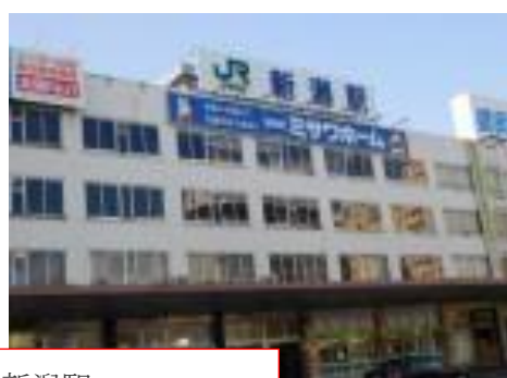
朝の東横インと新潟駅