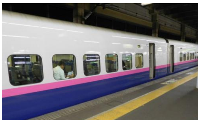
6月5日(月)とき340号で家路に

これで、47道道府県のうち新潟が踏破した県に新たに加わったので35(目標達成まで12)となった。また、通算営業キロは9,049km(活動回数450:目標達成まで951km)となった。