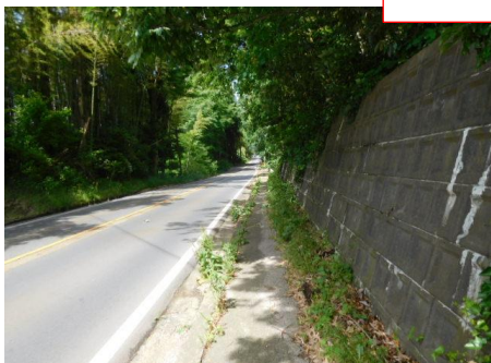
古津駅への路 古津駅

県道41号（白根安田線）を歩く。13時36分、新潟県立新津南高校前を通過。13時48分、常磐線の歩きで登場したような木々のトンネル風の道路を通過。13時59分、ウォーキングメンバーと会う。14時13分、古津駅に到着。この駅、道路前方を歩いていたウォーキング仲間と会う。一行はこの駅でアップのようであった。線路の右側を歩く。14時43分、セブンイレブン（田家一）に立ち寄り、アイスクリームを購入。磐越西線の長岡街道踏切を横切る。この踏切で方向性が混乱する。通行の方に聞いて、正しい方向に進むことができた。感謝また感謝。商船街を迂余曲折して、新津駅（羽越本線も合流）には15時15分到着。信越本線に加え、磐越西線や羽越本線が合流している駅であったので、駅前はそれなりに賑やかであった。